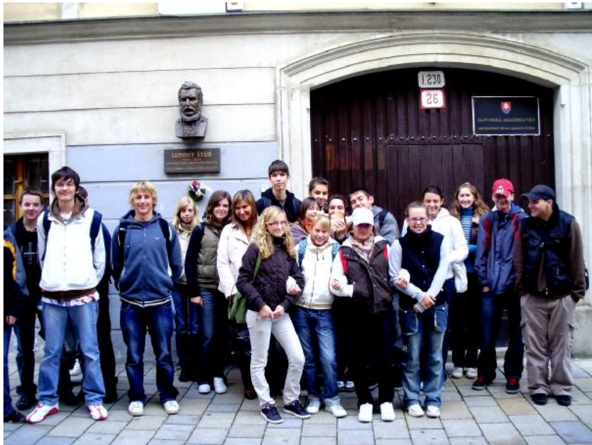
Vysmiata 1. A pred JÚ Ľ.Štúra SAV.